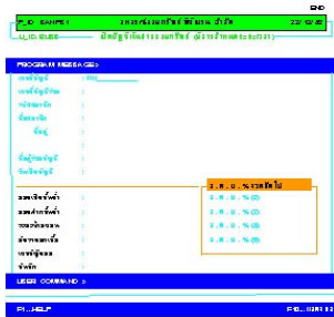
จอภาพแสดงการเปิดบัญชี