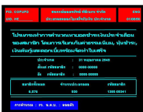
ประมวลผลใบเสร็จรับเงิน

ครั้งที่ 2. ประมวลผล เพื่อจัดทำใบเสร็จรับเงินเมื่อถึงวันสิ้นงวดจริง โดยแยกสมาชิกเป็น 2 กลุ่ม คือ กลุ่มไม่มีการเคลื่อนไหวระหว่างงวด และกลุ่มมีข้อมูลเคลื่อนไหว (ซื้อหุ้นเพิ่ม หรือชำระหนี้เงินกู้พิเศษ) ซึ่งทำให้ระบบการบันทึกใบเสร็จรับเงินของสมาชิกมีประสิทธิภาพมากขึ้น