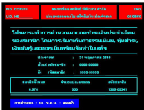
ประมวลผลใบแจ้งหนี้

ระบบการจัดทำใบแจ้งหนี้ (COS/VCI) จึงปรับเพิ่มให้มีการประมวลผล 2 ครั้ง ใน 1 เดือน/งวด คือ