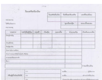
ใบเสร็จรับเงิน

ครั้งที่ 2. ประมวลผล เพื่อจัดทำใบเสร็จรับเงินเมื่อถึงวันสิ้นงวดจริง โดยแยกสมาชิกเป็น 2 กลุ่ม คือ กลุ่มไม่มีการเคลื่อนไหวระหว่างงวด และกลุ่มมีข้อมูลเคลื่อนไหว (ซื้อหุ้นเพิ่ม หรือชำระหนี้เงินกู้พิเศษ) ซึ่งทำให้ระบบการบันทึกใบเสร็จรับเงินของสมาชิกมีประสิทธิภาพมากขึ้น