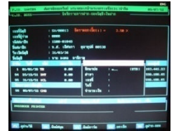
บันทึกรับเช็ค-เงินฝาก

ที่สำคัญเช็คทุกใบ สามารถเชื่อมโยงกลับไปสู่ต้นทาง ไม่ว่าจะเป็นเลขบัญชีเงินฝาก และเลขสัญญาเงินกู้ เพื่อให้เกิดความมั่นใจต่อวงจรรข้อมูล ที่มีที่มา-ที่ไปอย่างครบถ้วน