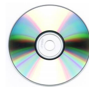
แผ่นข้อมูลส่งธนาคาร (BRPOST)