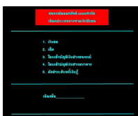
จอภาพเลือกเงื่อนไข

โปรแกรมจัดการออกใบเสร็จพิเศษอัตโนมัติ โดยกำหนดรหัสหมวด "26xxxxx"