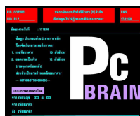
จอภาพประมวลผล